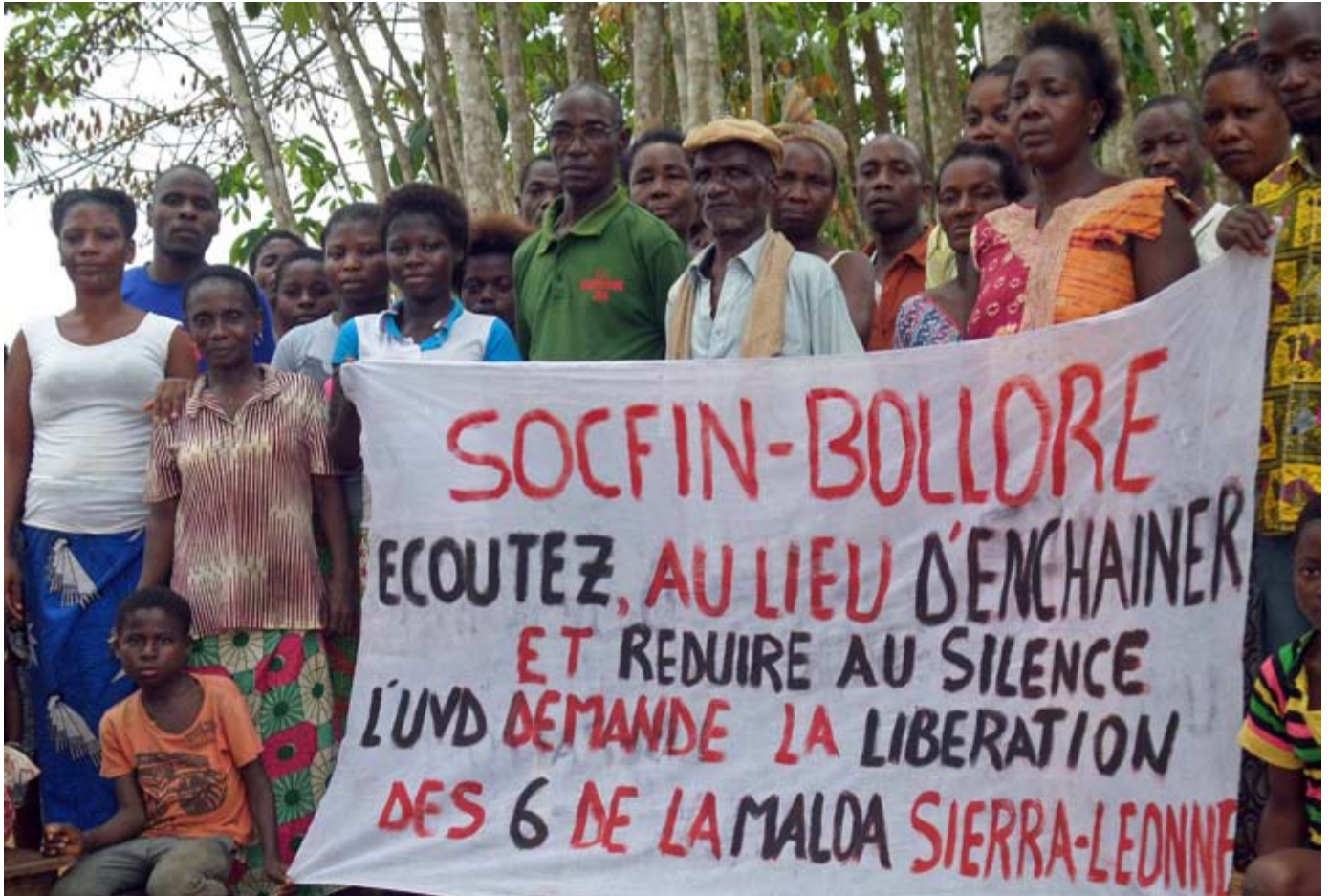
La expansión de los agronegocios es lo que ahora predomina. (Foto: Manifestación en una comunidad cerca de una plantación de Socfin en Costa de Marfil.

a incompetencia, arrogancia, inexperiencia o mala planificación, el colapso ayuda a explicar por qué el crecimiento en el número de negocios con tierras agrícolas desminuyó desde 2012 y por qué el número total de hectáreas también bajó.