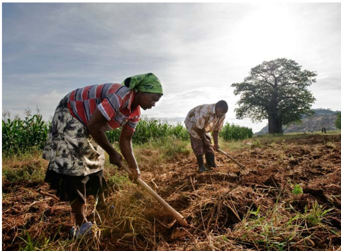
El acaparamiento global de tierras está lejos de terminar.