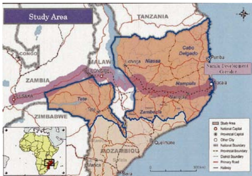
Imagen del Proyecto Estratégico del Corredor de Nacala de PEDEC (Proyecto das Estratégias de Desenvolvimento Económico do Corredor de Nacala, el Proyecto para Estrategias de Desarrollo Económico para el Corredor de Nacala), 2014.

El gobierno, las empresas y las agencias que promueven ProSavana y otros proyectos en el Corredor de Nacala, sostienen que los agricultores se beneficiarán con las nuevas inversiones, infraestructura y acceso a los mercados. También indican que los campesinos no