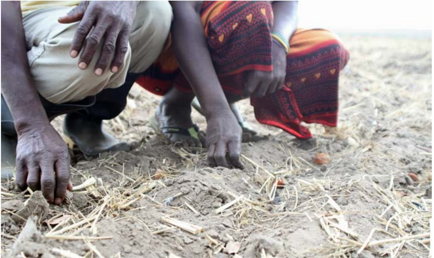
AgroMoz ha expulsado más de mil campesinos en Wakhua, en el distrito de Gurué.

en 2005. Con 3 mil hectáreas y a 15 kilómetros al oeste de la ciudad de Nampula, se estableció con apoyo de la ONG Technoserve de Estados Unidos y, más tarde, del IFC del Banco Mundial. 29