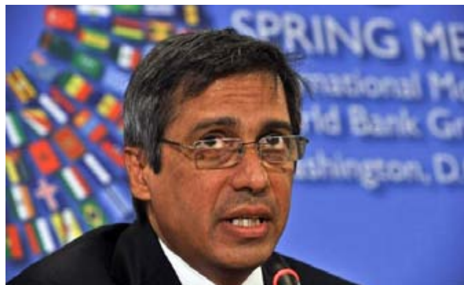
Ministro de Finanzas de Mauricio, Charles Gaëtan Xavier Luc Duval