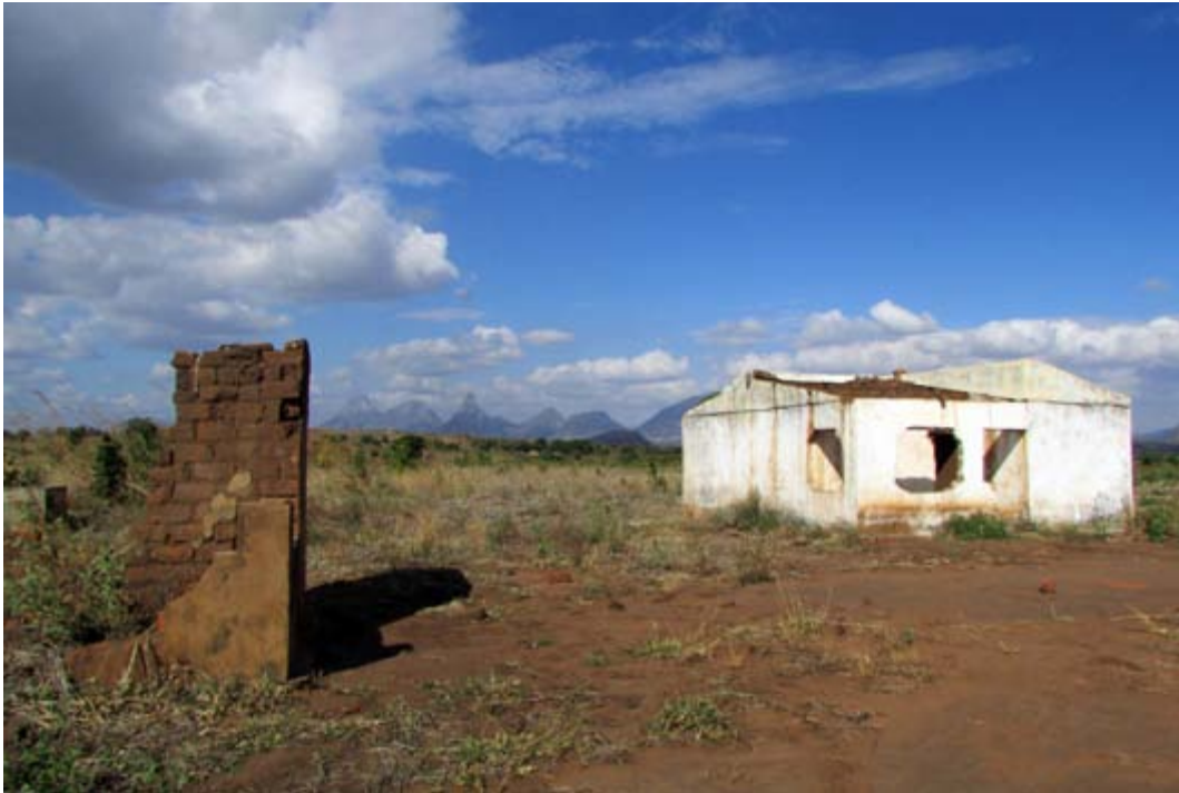
Foto de la casa de una familia reubicada por Mozaco.

para la inversión extranjera en agricultura, el gobierno de Mozambique se colude con los inversionistas extranjeros para entregarles extensos contratos de arriendo sobre estas mismas tierras. El eco colonial es reforzado por el hecho de que algunos inversionistas son familias portuguesas que se hicieron ricas durante el periodo colonial y ahora vuelve a Mozambique a establecer plantaciones en las mismas tierras que los colonos portugueses abandonaron hace 40 años. Pocos de ellos tienen conocimientos en agricultura, pero muchos tienen conexiones con influyentes miembros del partido gobernante Frelimo, que los ayudó a adquirir las tierras y manejar cualquier oposición que mostraran las comunidades locales.