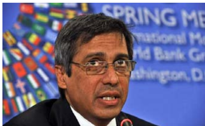
Ministro de Finanzas de Mauricio, Charles Gaëtan Xavier Luc Duval