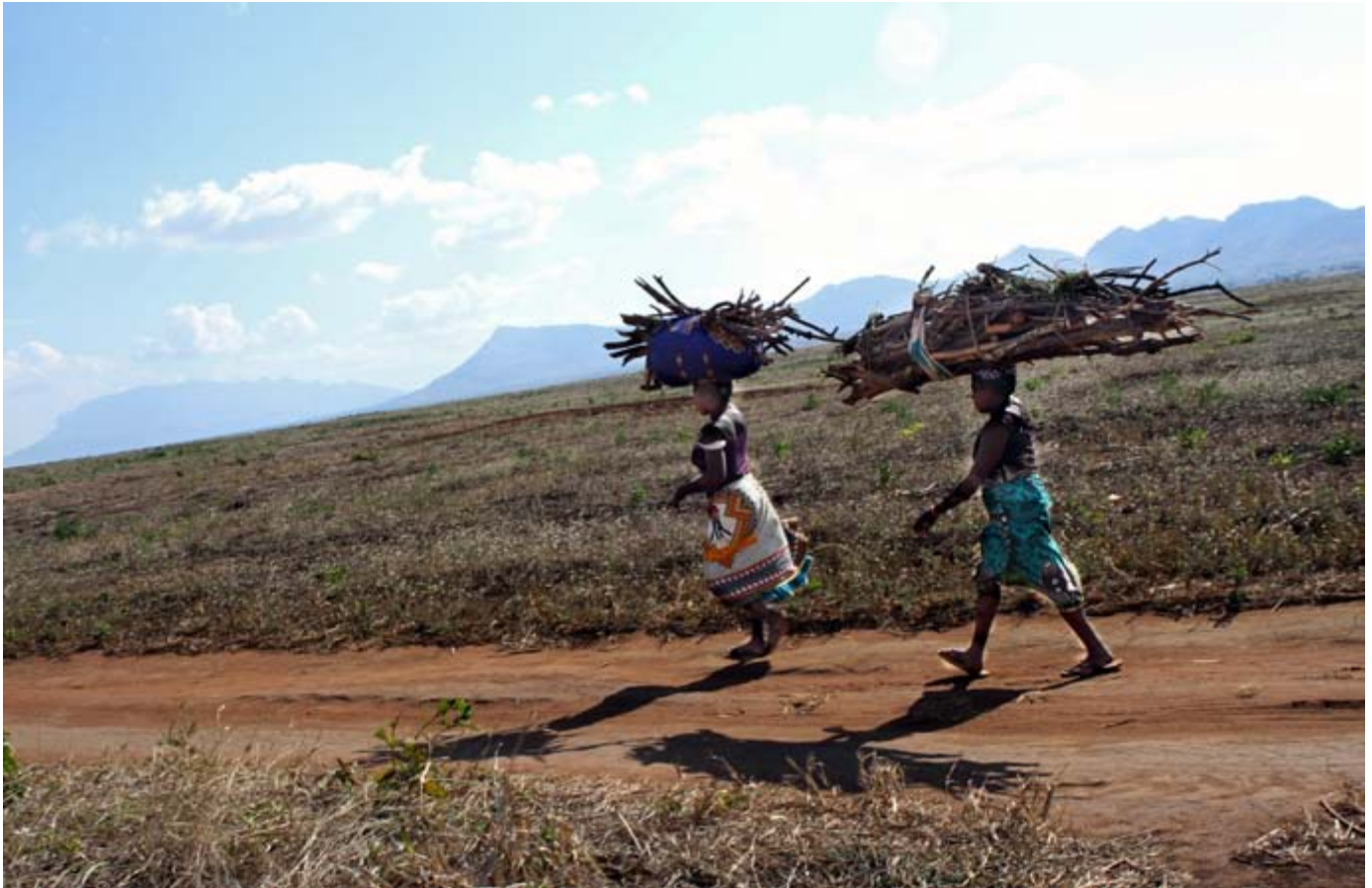
Miles de familias campesinas fueron ya desplazadas y las tierras se le entregaron a los empresarios europeos y estadounidenses con mecanismos financieros muy astutos pero con poca experiencia en agricultura.