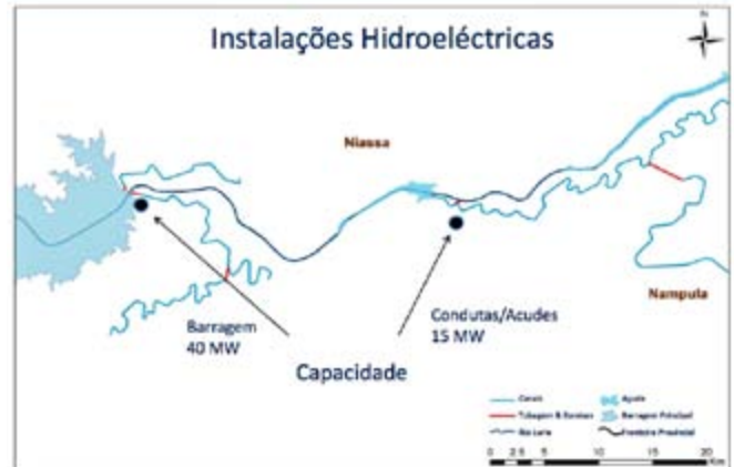
Diapositiva adaptada de una presentación hecha por Companhia de Desenvolvimento de Vale do Rio Lúrio en enero de 2014.

y ganado, así como caña de azúcar para biocombustible. Estimaciones preliminares indican que más de 500 mil personas que viven en el área serán afectadas por el proyecto. Como con ProSavana, los detalles del proyecto se han mantenido en secreto para el público, y fuentes anónimas señalan que ya fue enviado al Ministerio de Agricultura para su análisis, con la expectativa de que será aprobado por el Consejo de Ministros, como se requiere por ley para proyectos de esta magnitud.